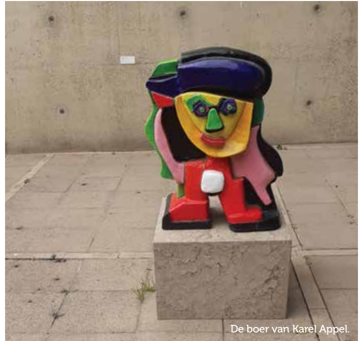
De boer van Karel Appel.

Maar ook omdat, zeker door de corona, het besef van kwetsbaarheid van het leven op ons af is gekomen. We zijn op onszelf