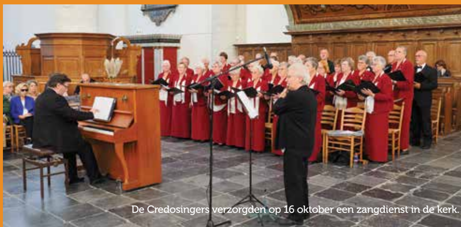
De Credosingers verzorgden op 16 oktober een zangdienst in de kerk.